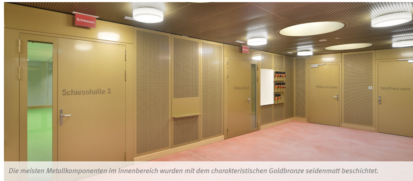
Die meisten Metallkomponenten im Innenbereich wurden mit dem charakteristischen Goldbronze seidenmatt beschichtet.

ken harmonieren in ausgewogener Farbensprache mit den Betonwänden und Holzapplikationen. Je nach Lichteinfall und -quelle spielt die Pulverbeschichtung in verschiedenen Nuancen, ohne jedoch visuell zu dominieren. Der Goldton gibt der nüchternen Trainingsanlage eine spezielle, wärmende Note. Auch das von Denzler entwickelte Loch-Schriftbild kommt auf den Oberflächen in Gold besonders gut zur Geltung.