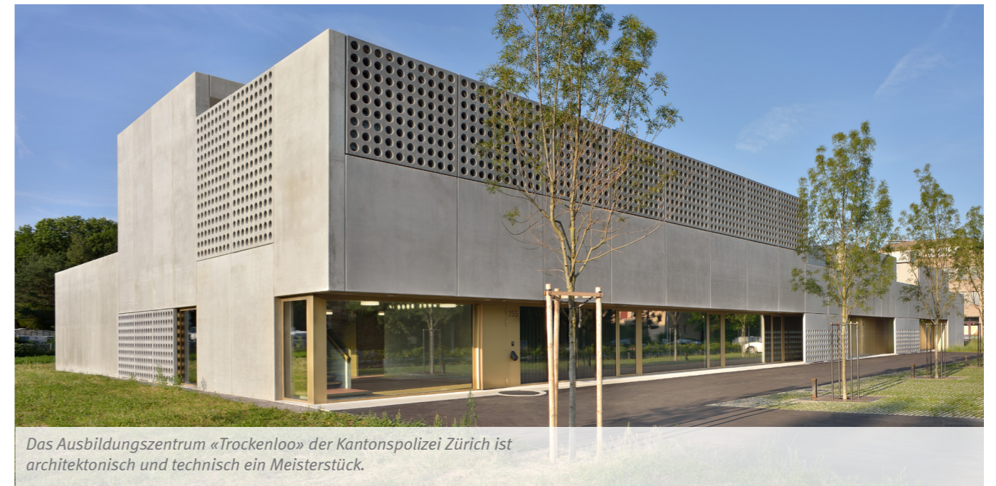
Das Ausbildungszentrum «Trockenloo» der Kantonspolizei Zürich ist architektonisch und technisch ein Meisterstück.