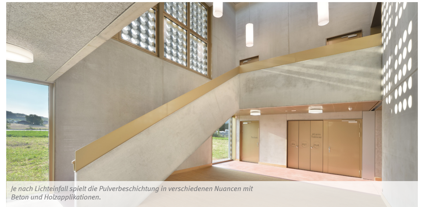
Je nach Lichteinfall spielt die Pulverbeschichtung in verschiedenen Nuancen mit Beton und Holzapplikationen.