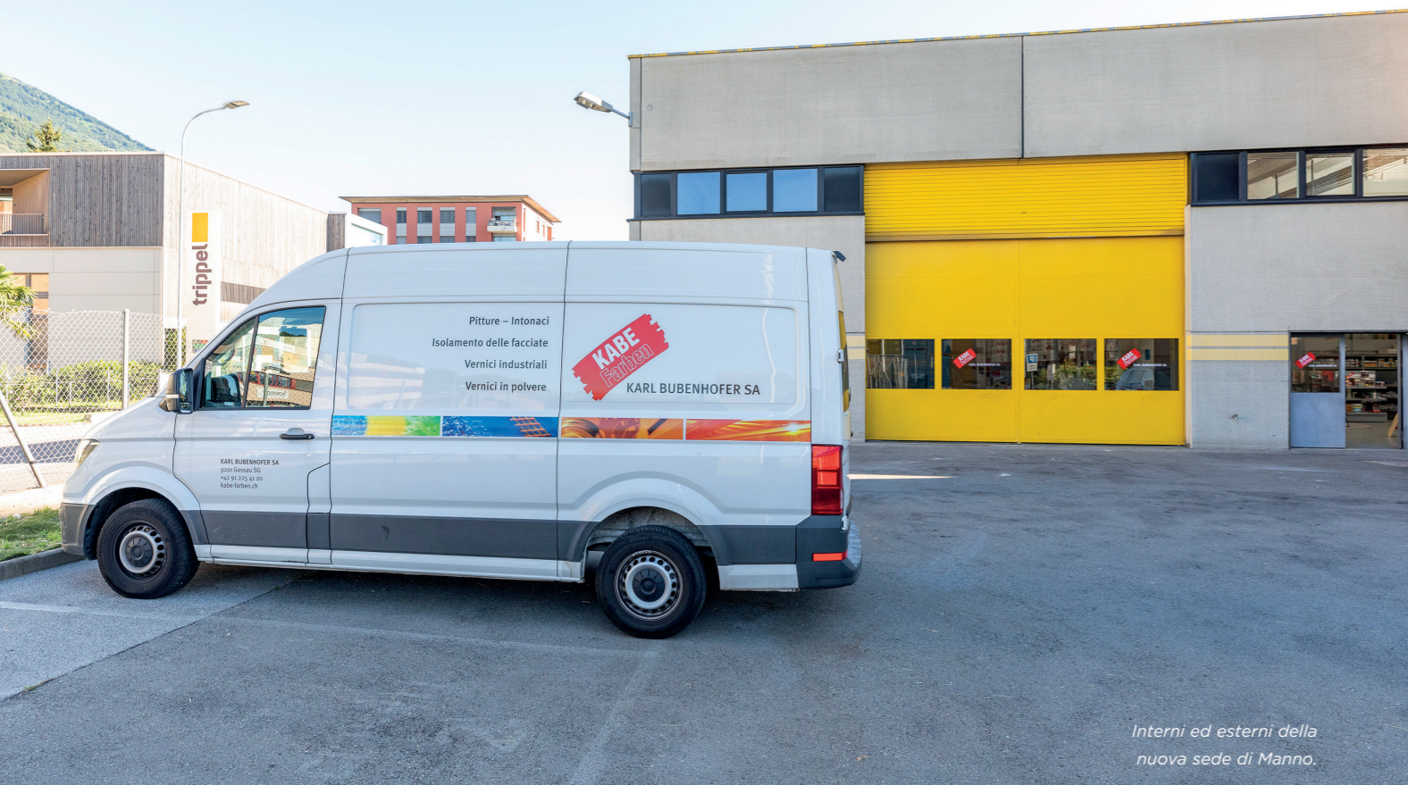
Interni ed esterni della nuova sede di Manno.