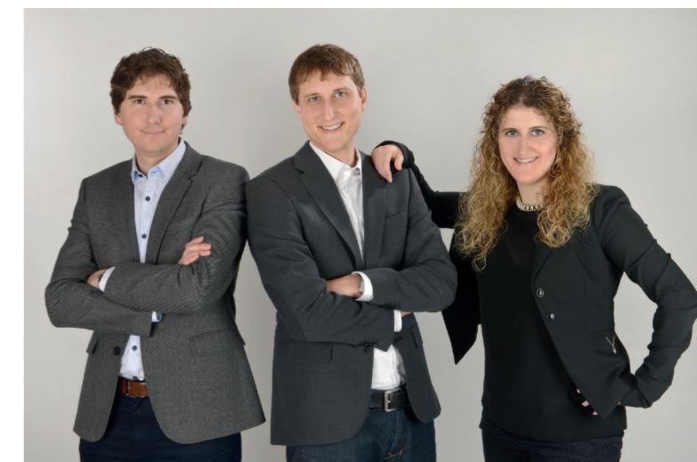
La quarta generazione Bubenhofer e la sede di Gossau.

Iniziamo la seconda metà dell'anno con ottimismo e affrontiamo con entusiasmo le sfide del nostro complesso settore.