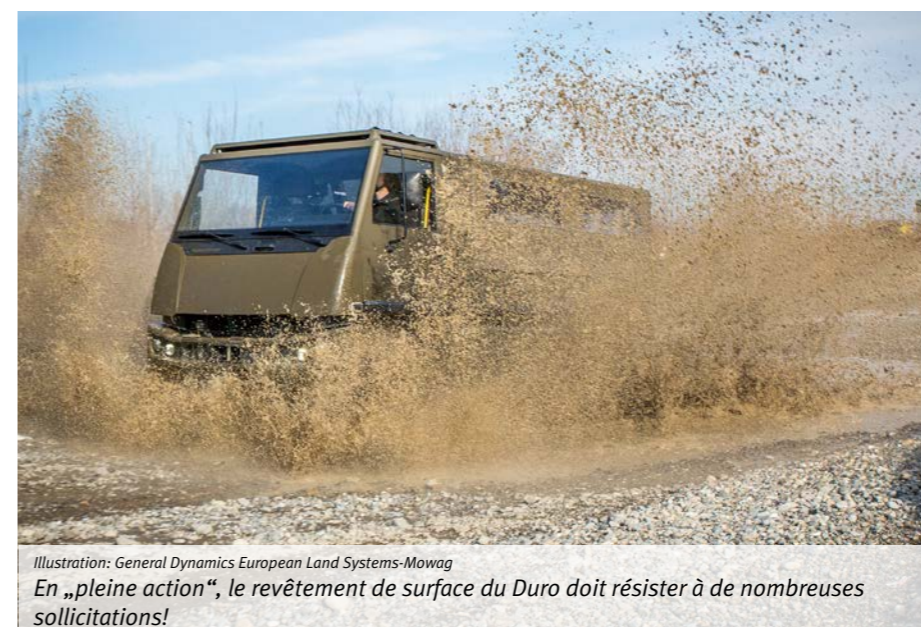
Illustration: General Dynamics European Land Systems-Mowag

Les parties plates, telles que portes en aluminium, sont recouvertes du vernis en poudre KARL BUBENHOFER SA, approprié aux exigences de l'armée.