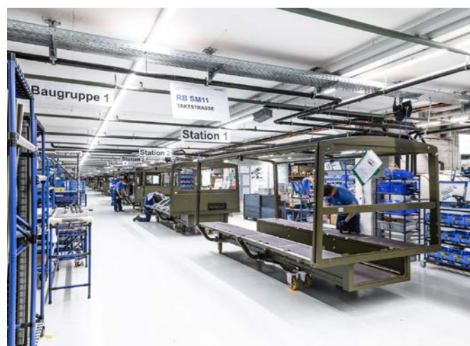
Illustration: VERWO /visualarte ©Martin Eschmann

Les structures de transport pour les Duro sont entièrement fabriquées et assemblées chez VERWO AG à Reichenburg.