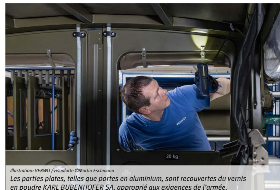
Illustration: VERWO /visualarte ©Martin Eschmann

Grâce à l'étroite collaboration avec VERWO et Kistler Stahlbau Spritzwerk AG, KARL BUBENHOFER SA a, en un court laps de temps, conduit ce développement en phase de production. Les experts de Gossau ont ainsi une nouvelle fois prouvé leur puissant potentiel de développement et leur flexibilité absolue avec, dans ce cas, même un système de vernis en poudre qui fait „disparaître“ la nuit des véhicules entiers!